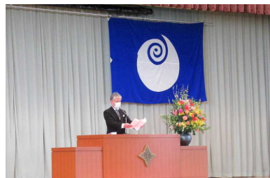
入学式・校長式辞

生徒の皆さんが充実した学校生活が送れるよう、そして自分の夢の実現に近づけるよう、協力していきたいと思っています。どうぞよろしくお願いいたします。