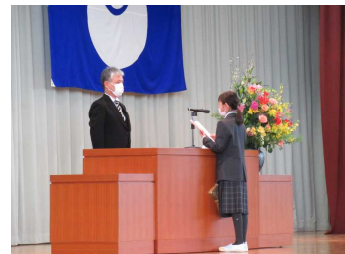
新入生代表 誓いの言葉