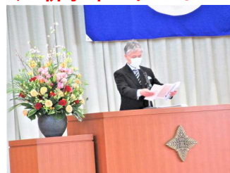
<入学式・校長式辞>