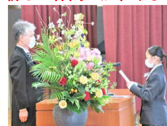
<新入生代表 誓いの言葉>