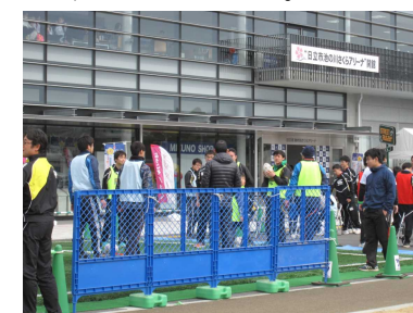
ストリートラグビー