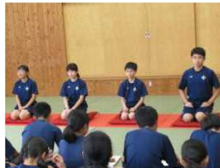
▲高野家まさぺえ「初天神」