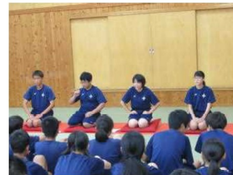
▲ステーキ「さぎとり」